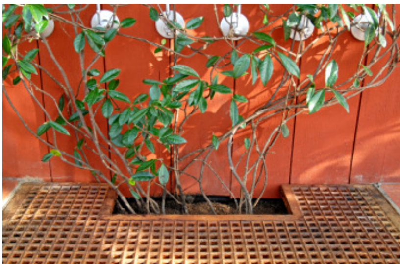
Ett funktionellt och vackert galler som gjuts i Skottland.

Så bland annat var det fastighetschefen själv som var med och valde gjutjärn till vissa centrala detaljer, som skyddsgallren runt inomhusträden och gallren till luft- och vattenavrinningskanalerna som löper utmed hela glasväggen.