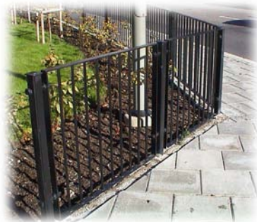
Nordhägnstaket vid snabbspårvägen i Alvik