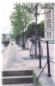
Stamskydd 510201 utanför Sheraton i Göteborg

Ett exempel på vår förmåga att rekonstruera gamla former. Staketet står utanför Tingvalla gymnasium, Karlstad.