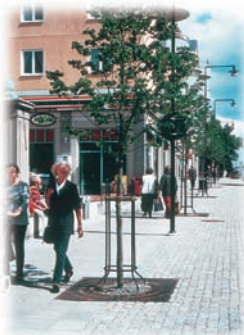
Stamskydd 2110 och Markgaller 457210 på Sturegatan i Sundbyberg

Många fler referensbilder finns dessutom att se om Du klickar in Dig på olika produktområden på www.jom.se