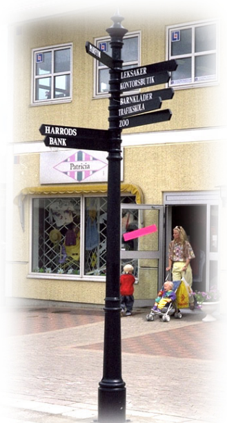
Vägvisare 910000 i Kungälv

Några av de referenser som vi gärna hänvisar till är: