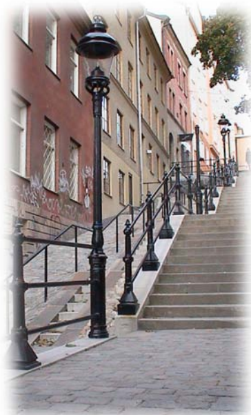
Kvarngatan på Söder i Stockholm. Stolpe 220001, Lyktstolpe 611000 med Lykta 650000.

Hammarby Sjästad, Stockholm. Stamskydd 510106, Markgaller 457210 samt Betonglåda 4772