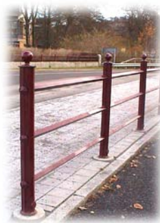
Nordhägnetaket i Mölnlycke

Fler referensbilder finns på nästa sida och under våra produkter på www.jom.se