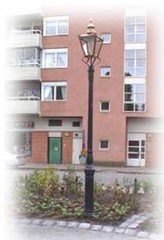
Parkstolpe 611000 med Winsorlykta i Åkersberga