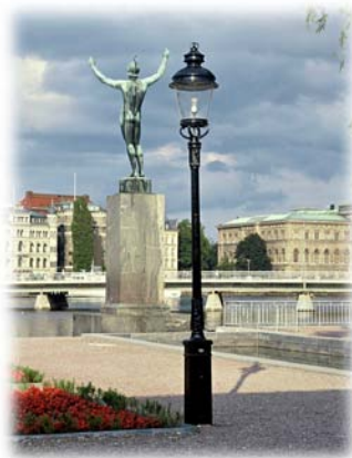
Sverigestolpen med Kungsslyktan på Strömparterren i Stockholm.

Med detta sätt att organisera våra resurser har vi skapat maximal effektivitet med minimala kostnader och stor kapacitet. Resultatet är ett prisvärt kvalitetssortiment med stor bredd.